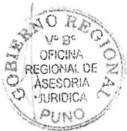
AGUSTIN LUQUE CHAYÑA GOBERNADOR REGIONAL (E)